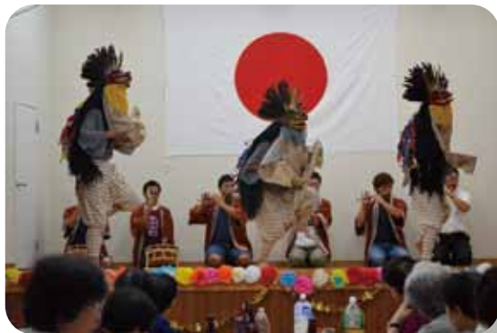
20年ぶりに 獅子を舞う

日本の社会は「77才喜寿、 88才米寿、90才卒寿、99才 白寿」と高齢を心から祝う 社会です大切にしていきたい