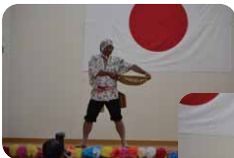
余興の取りは 「安き節」