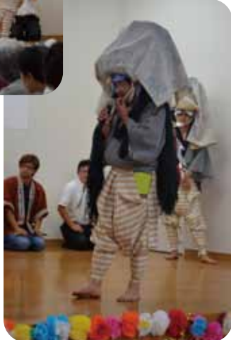
下之郷三頭獅子舞保存会の 仲間達